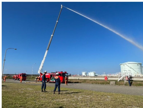
コンテスト競技中の風景（最優秀賞受賞組織）