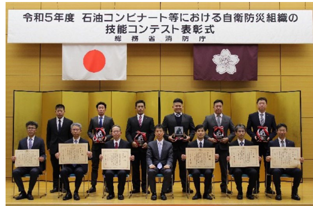
受賞組織との記念撮影