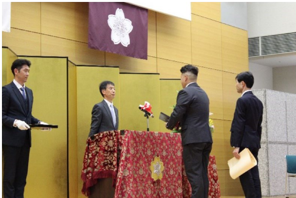
最優秀賞 関西国際空港航空機給油施設自衛防災組織

令和5年12月8日に、中央合同庁舎第二号館（総務省）地下2階講堂（東京都千代田区霞が関二丁目1番2号）において、表彰式を開催し、原消防庁長官から最優秀賞、優秀賞及び奨励賞を受賞した6組織に表彰状と記念品を授与しました。